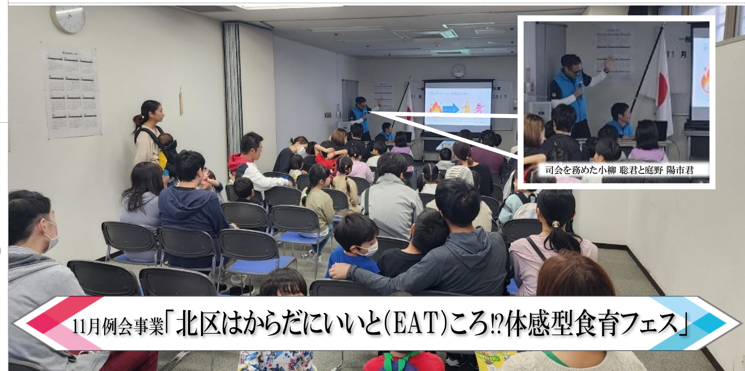
11月例会事業「北区はからだにいいと(EAT)ころ!?体感型食育フェス」