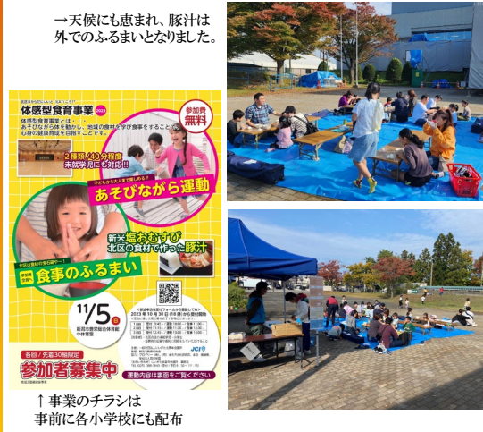
一天候にも恵まれ、豚汁は外でのふるまいとなりました。

参加者からは「座学で学んだことを、遊びながらもつと学べることできてよかった」「豚汁にどんな栄養素が入っているかが体をつくるものになっていくことが良く分かった」などと声が上がりました。今年度最後の対外事業となりましたが、これからも地域の子供たちや地域に目を向ける事業を展開してまいりたいと思います。