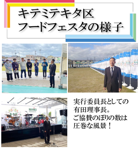
キテミテキタ区 フードフェスタの様子