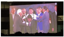
プレジデンシャルリースの伝達において は、麻生会頭のご尊父、麻生太郎氏 がアテンドし、会場から大きな拍手が 巻き起こりました。

と会得しシものた口 聞動大Jを金講ン京 者のたたヨ新大メッ式くの交C持ー演グに今年 え成ヒ。ンたきンク典こヒ興をたかでコて年度 て功ンこをにさバ大&とン味村せらはン行度 おにトの受イに1会卒がト深にたJ、グわの りもが全けん圧がを業でとく例講C著西れ全 まつブ国取ス倒、間式きな、え演へ書野ま国 すな口大っピさス近でまる今たとのー亮し大 。がッ会てしれケにはし講後内な関夢廣た会 ックかい1つ1控、た演の容り連と氏。は た大らま つルえブ。を活は、性 のキ東