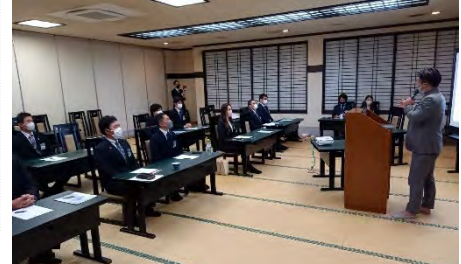
←真剣に聞き入るメンバーたち